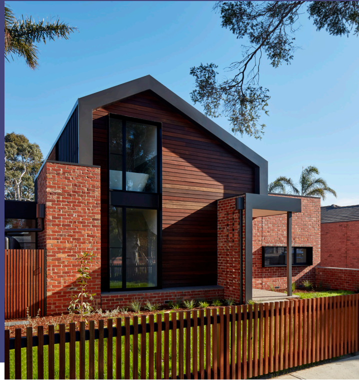
工程：维多利亚州 Mancini Made 设计的联排别墅 建筑师：Drew Building Design 产品：Charisma/Electro in Black Ace